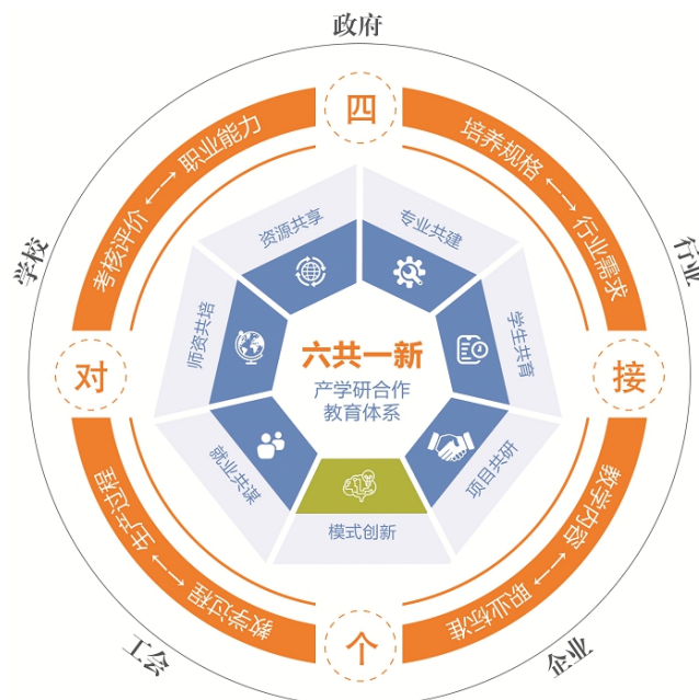
图1 产学研合作教育体系

一是实行校政行企会协同育人机制，建立了“六共一新”产学研合作教育体系。校政行企会参与学校治理、人才培养，多主体办学，围绕学生共育、专业共建、资源共享、师资共培、就业共谋、项目共研，实现应用型人才培养模式创新。二是初步建成乡村振兴学院、公共安全学院、劳模学院等3个产业学院，学校投入资金1500余万元，企业投入资金426万元及实验室设备值500余万元。与山东浪潮集团、青岛青软科技集团等企业共建专业15个，共建校外实践基地124个，获教育部产学研协同育人项目122项，校企合作覆盖全部本科专业。三是深耕校会融合，助力应用型人才培养。持续打造山东省工会干部教育培训基地、工会理论研究基地、产业工人素质提升基地和工会专业人才培养基地等四个基地，聘任53名“劳动模范”“齐鲁大工匠”为德育和实践导师，与各地工会建立了紧密的组织网络，建成职业技能与工匠人才库。