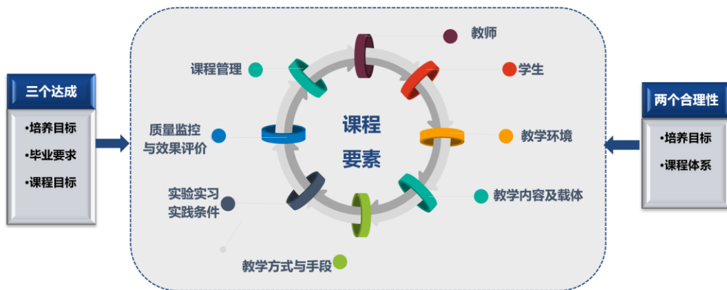
图3 建设与评价一体化体制机制