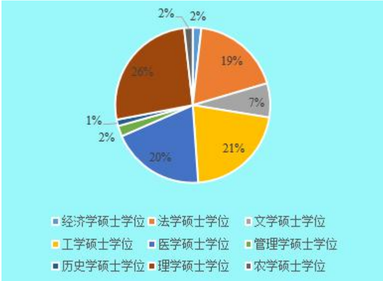
图 1 硕士科学学位授予分布图

218 人，全日制硕士专业学位 324 人，在职专业学位及同等学力申请硕士学位 89 人。具体结构分布见下图：