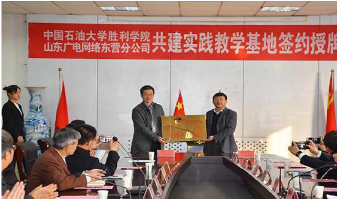
图 4-1 学院与山东广电网络有限公司东营分公司共建实践教学基地