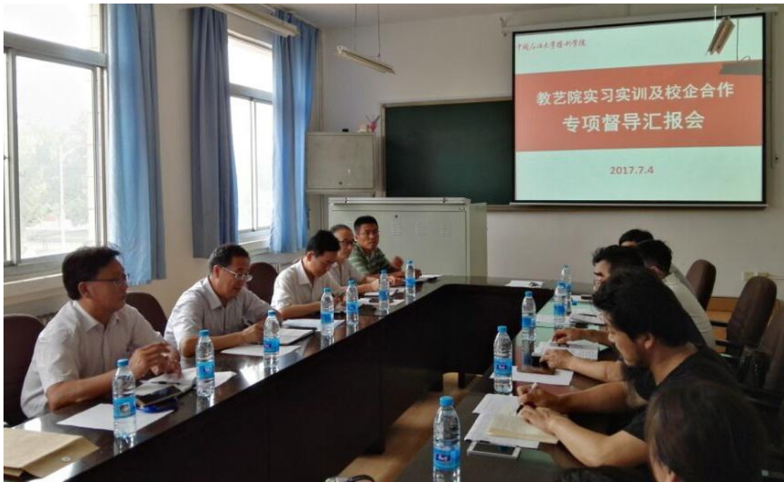
图 5-4 实习实训督导组赴教育与艺术学院开展专项调研