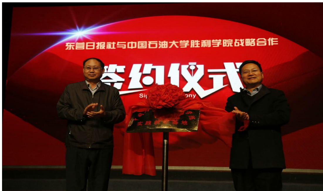
图 4-2 学院与东营日报社建立战略合作伙伴关系