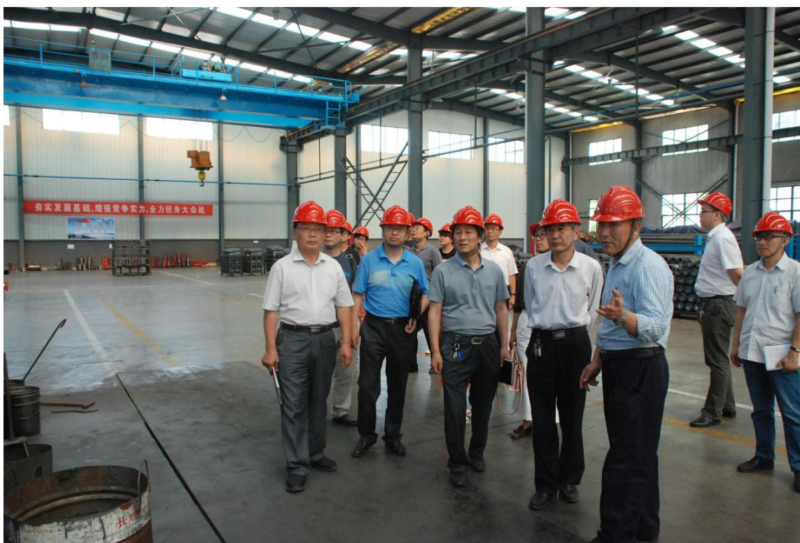
图 5-3 实习实训督导组赴东营威玛钻具有限公司考察交流（2017-6-8）