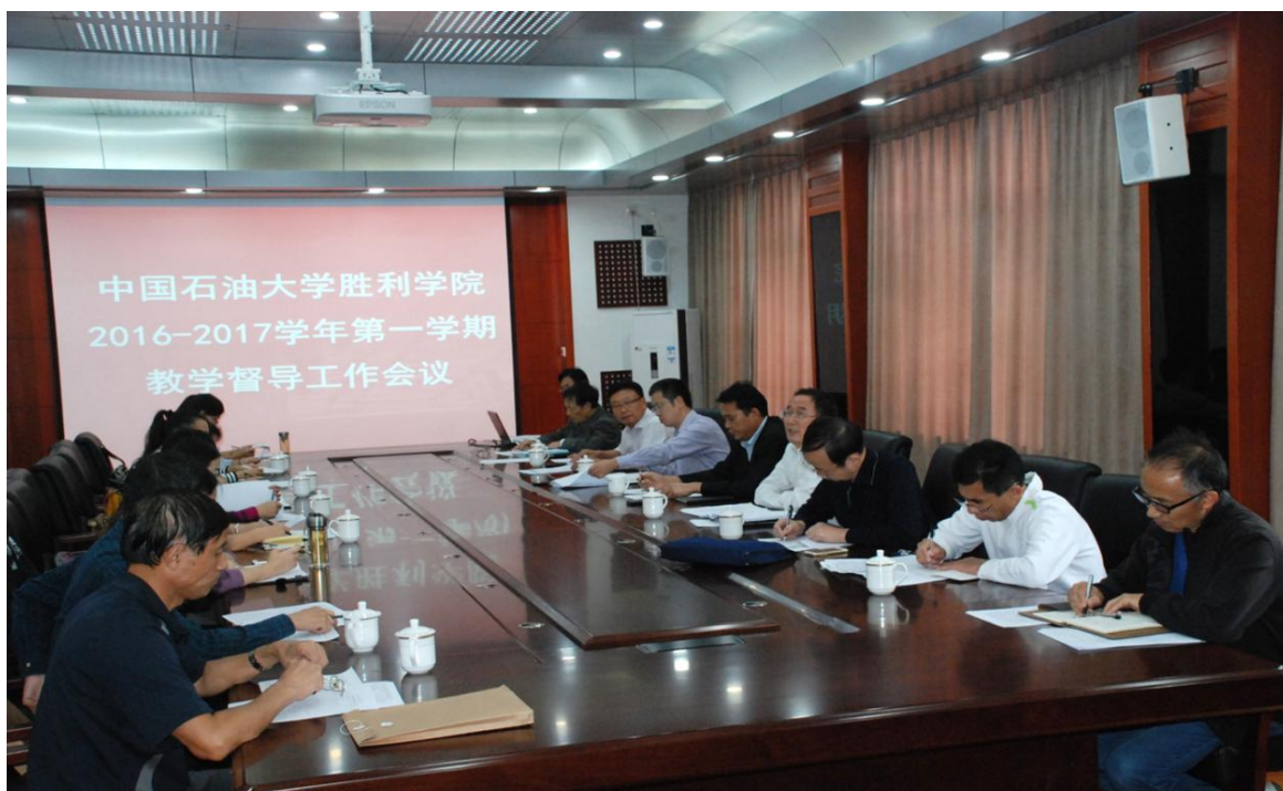
图 5-1 中国石油大学胜利学院 2016-2017 学年第一学期教学督导工作会议（2016-9-27）