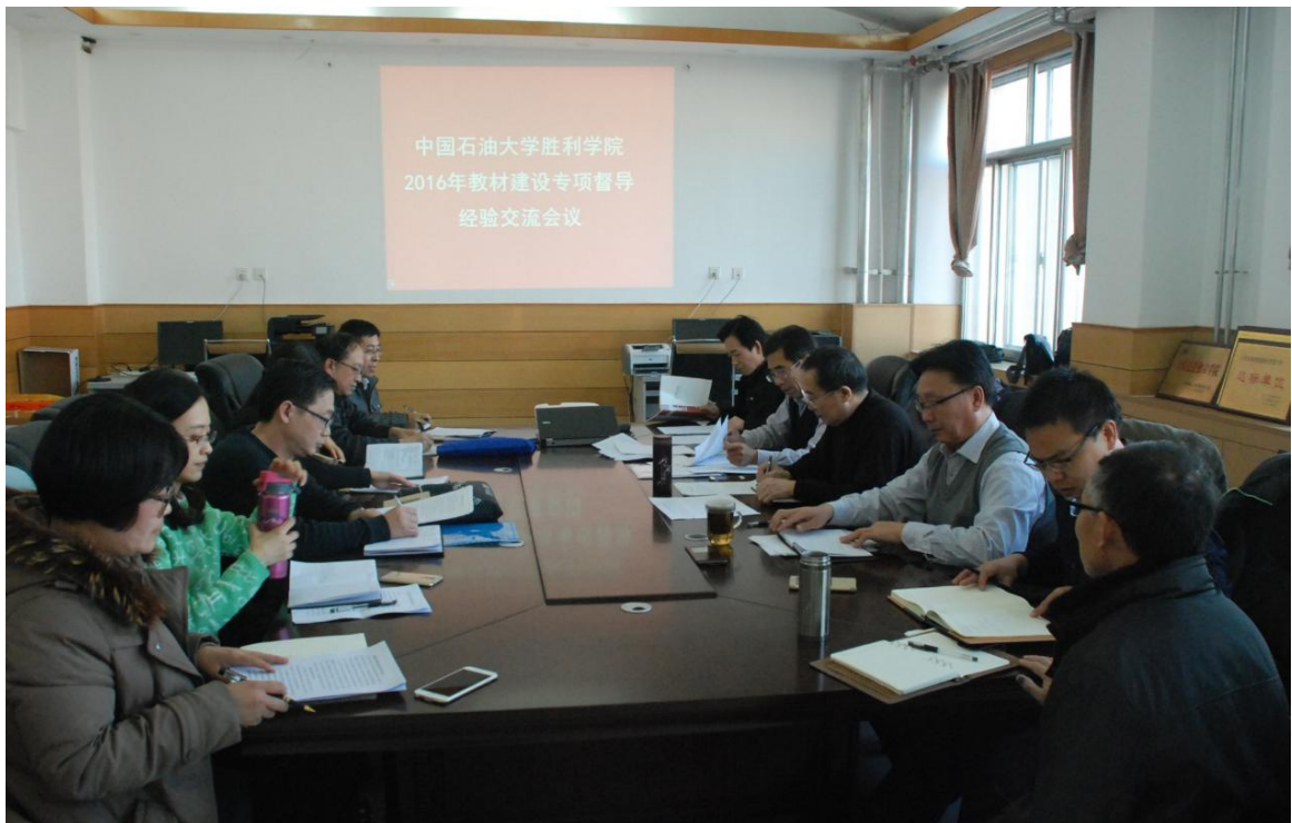
图 5-2 教材建设专项督导组召开院系教材建设情况调研会（2016.10.23）