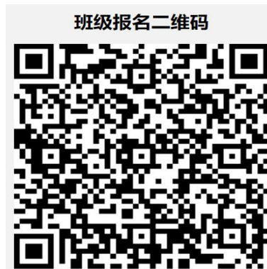
全国职业院校汽车检测与维修技术专业 骨干师资培训报名二维码