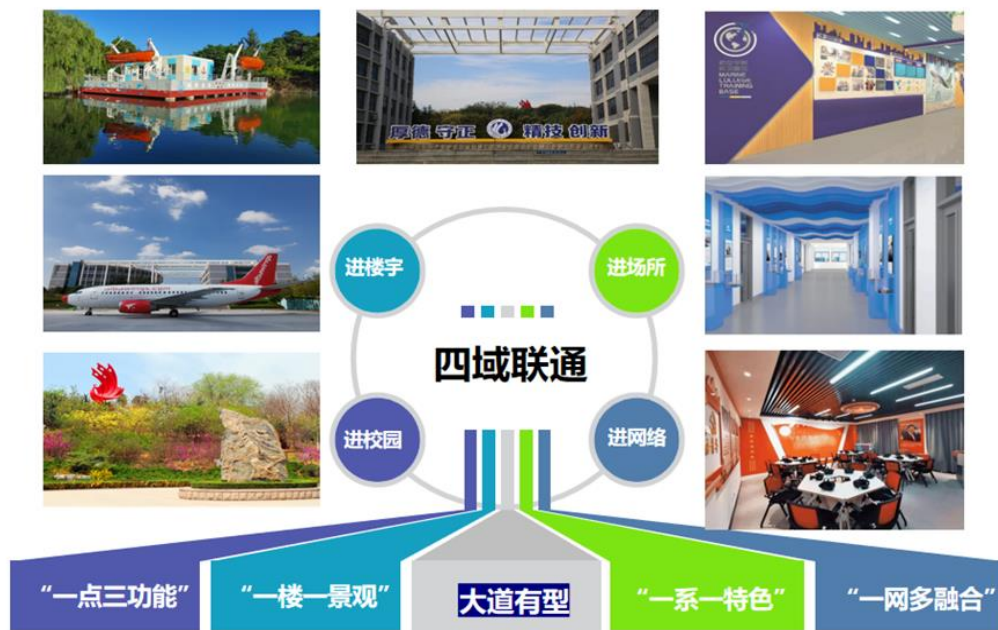
图3 “四域联通”全方位育人环境

(四) 打造了“大道致远”文化行为路径。通过课堂释惑、实践躬行、社会感悟、网络浸润，塑造“精技之路”“心航之路”“创新之路”育人路径，践行“志于道 精于业”学风，培养“德技并修”交通匠才；塑造“决胜之路”“先锋之路”“匠心之路”育人路径，践行“施仁爱 育匠才”培育“德艺双馨”交通匠师，形成了“一路有爱”文化品牌，打造了“双元融合，六路融通”的师生发展共同体。