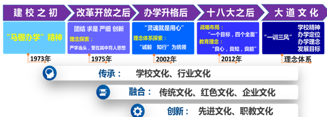
图1 “大道文化”研究成果形成过程

建校之初，形成的“马棚办学精神”是当时“两路精神”职业教育领域的生动实践，传承至今；改革开放之后，交职人主动适应办学治校、教书育人的新要求，以“团结 求是 严细 创新”的理念，汇聚新的发展力量；2002年，学校独立升格为高等职业院校。提出“灵魂就是用心”的工作理念，总结形成“严字当头，爱在其中”的仁爱育人思想，在校企共建中引入优秀交通企业文化，并探索以学校所在“齐”“鲁”交汇地的优秀传统文化和校内“潍县战役”遗址的红色基因育人，并于2009年正式启动文化育人创新与实践项目建设；党的十八大以来，面对培养新时代“四有”好老师的新职责，面对培养技术技能人才的新使命，创新以“爱国主义”为核心的社会主义先进文化和以“工匠精神”为代表的新时代职教文化。2014年凝炼形成“大道文化”内涵，以更厚重的文化支撑学校事业发展。