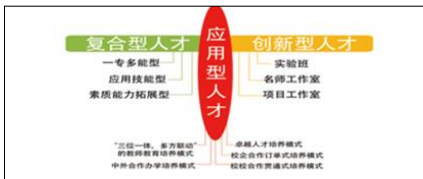
图 4.1 多元化人才培养模式

“复合型”、“创新型”人才培养为辅的“一体两翼”人才培养格局。构建了应用型人才培养模式、卓越人才培养模式、校企合作人才培养模式、校校合作贯通式培养模式、“三位一体，合作联动”教师教育培养模式、中外合作办学人才培养模式，彰显出学校完善的应用型人才培养体系。拥有 2 个省级人才培养模式创新实验区，6 个校级人才培养模式创新实验区（见表 4.5）。