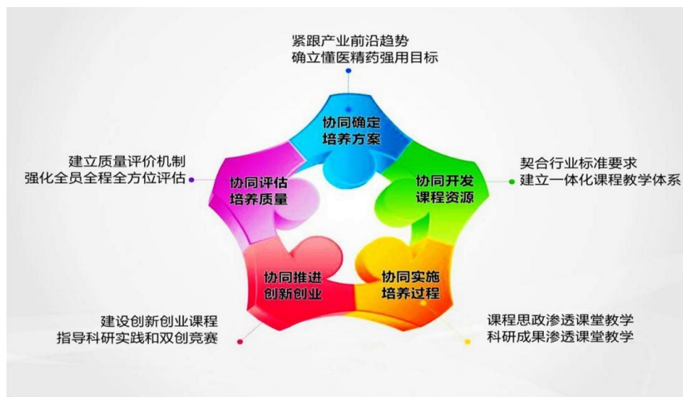
图2 药学专业“五协同”产教融合培养体系

协同确定培养方案。 教学委员会每学年召开1次教学工作会议，以“立德树人、医药融合、懂医精药”思想为引领，将“产业基因”融入人才培养方案，以产业需求为导向，引入医药行业标准和岗位资格标准，重构专业课程体系，确保专业培养目标与产业人才需求变化同步对接。