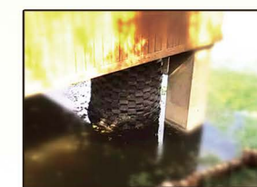
滨州市三河湖风景区试点