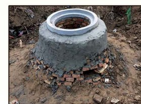
无棣县五营村试点