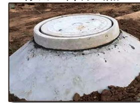
滨州职业学院科研基地试点