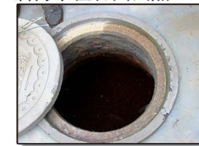
博兴县周刘村试点