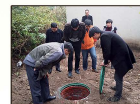
淄博市植物园试点